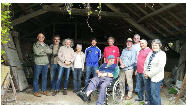
Visite de la tuilerie

Les bénévoles de VLCP ont donné de leur temps pour restaurer la fontaine du Donjon et son petit pont (derrière le garage Chassot, rue Georges Gallay), mais aussi la cheminée du four à pain et le puits de la maison du Canal d'Avrilly (futur lieu d'hébergement de la ComCom). Nous avons également reçu de nombreux objets et outils de l'activité économique de notre campagne d'antan.