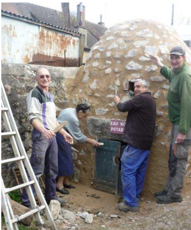
Restauration de la fontaine du Donjon

Notre association, qui œuvre à la mise en valeur du petit patrimoine bâti de notre territoire communal, a connu une année particulièrement dense.