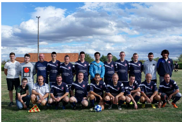
Dans la foulée de la victoire de la France à la

coupe du monde en juillet, le FC Est Allier a repris la saison 2018-2019 tambour battant, avec 5 équipes dont une sénior et 4 de jeunes permettant aux jeunes filles et jeunes garçons de 5 à 13 ans de pratiquer le seul sport collectif sur notre territoire, et ce avec une licence accessible à tout le monde.